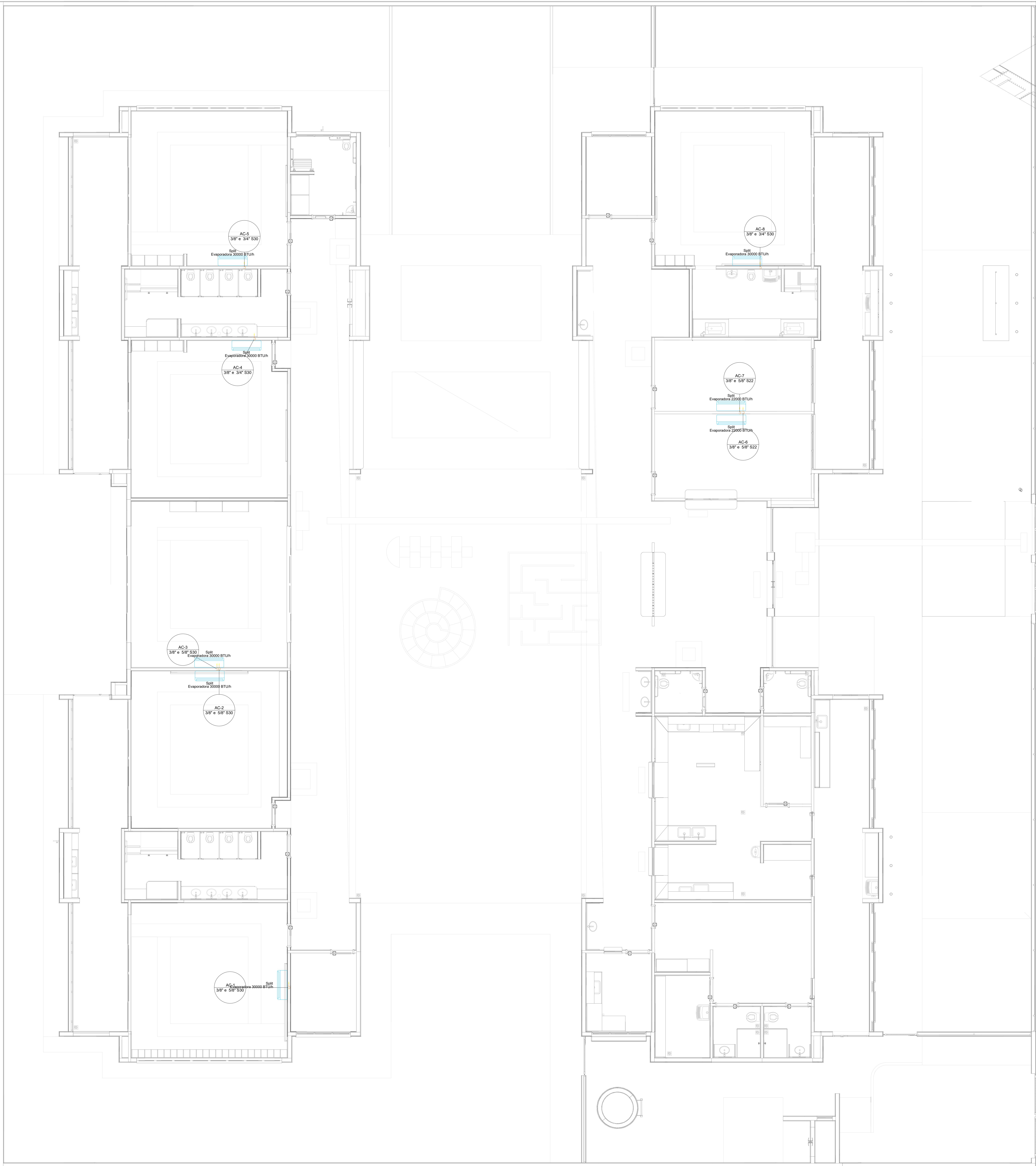
1 PLANTA BAIXA TÉRREO ESCALA 1/50